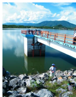
Obra de toma y puente de ingreso a las máquinas.