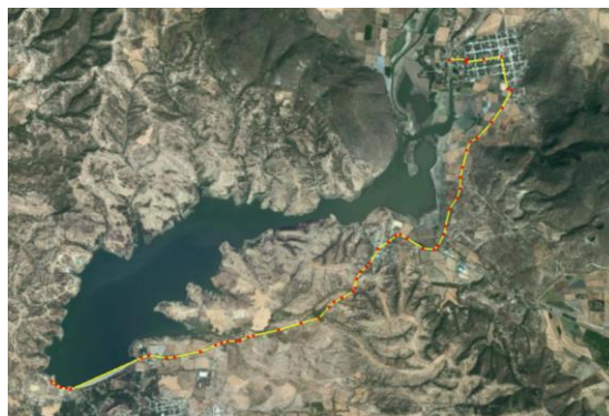
Propuesta inicial de la poligonal de apoyo.

El objetivo del proyecto de sobre elevación de la Presa Valerio Trujano, es garantizar el suministro de agua para uso doméstico y municipal de la ciudad de Iguala, Gro., así como el riego del total de la superficie del Módulo de Riego Valerio Trujano.