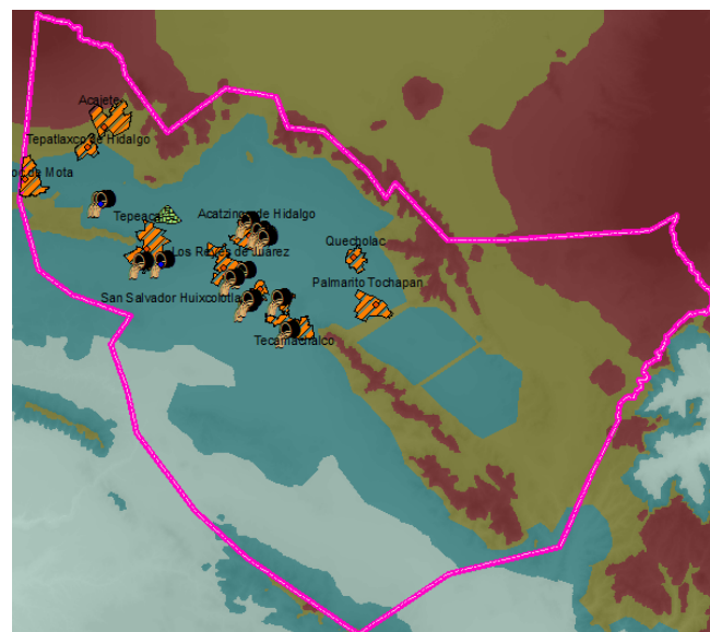
Ubicación de los sitios de contaminación por aguas residuales.

Debido a las características geohidrológicas, el acuífero presenta una considerable susceptibilidad a la contaminación, tanto natural como antropogénica. En